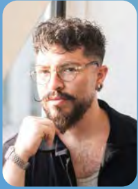
AGENCIA PEGAJOSA Pablo Fattori @pegajosacl