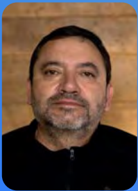
CENTRO CULTURAL DE PROMOCIÓN CINEMATOGRAFICA DE VALDIVIA Fernando Lataste @ficvaldivia