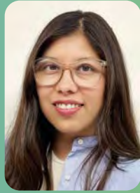
CAROLINA RECORDS Carolina Barraza @carolina.records