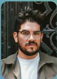
LA CORDILLERA RECORDS Christian Bastías @lacordillerarecords