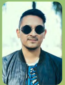
RED PONCHO Pablo Sainz @redponchocl